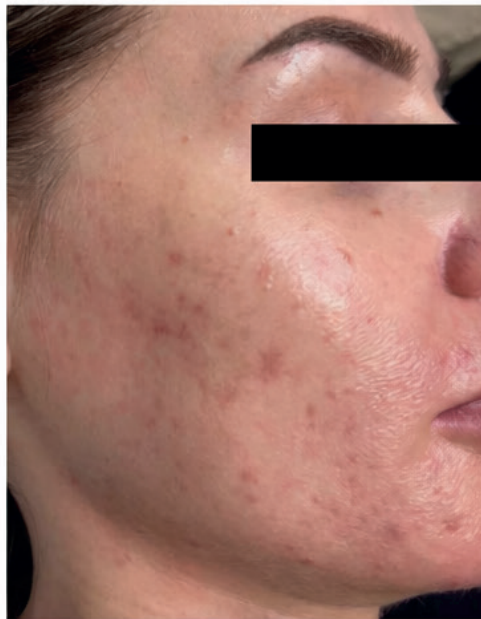
< Después de 1 sesión >