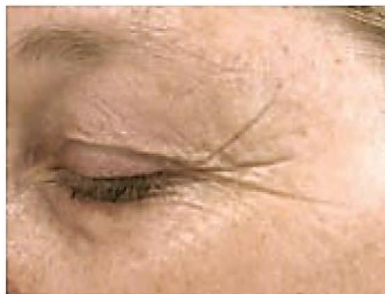
&lt; Antes &gt;