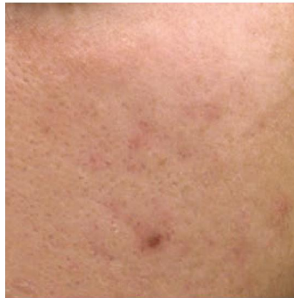
&lt; Antes &gt;